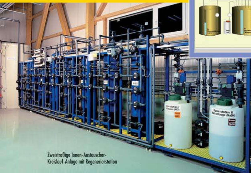
Zwei-stufige Ionen-Austauscher-Kreislauf-Anlage mit Regenerierstation