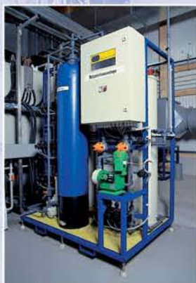
Retardationsanlage zur Eloxalbadpflege