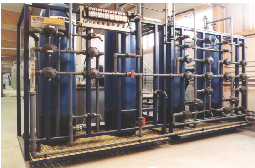
Bild: Automatische regenerierbare Selektiv-Kationen-Austauscher-Anlage mit vorgeschalteten Adsorber- und Kiesfilter